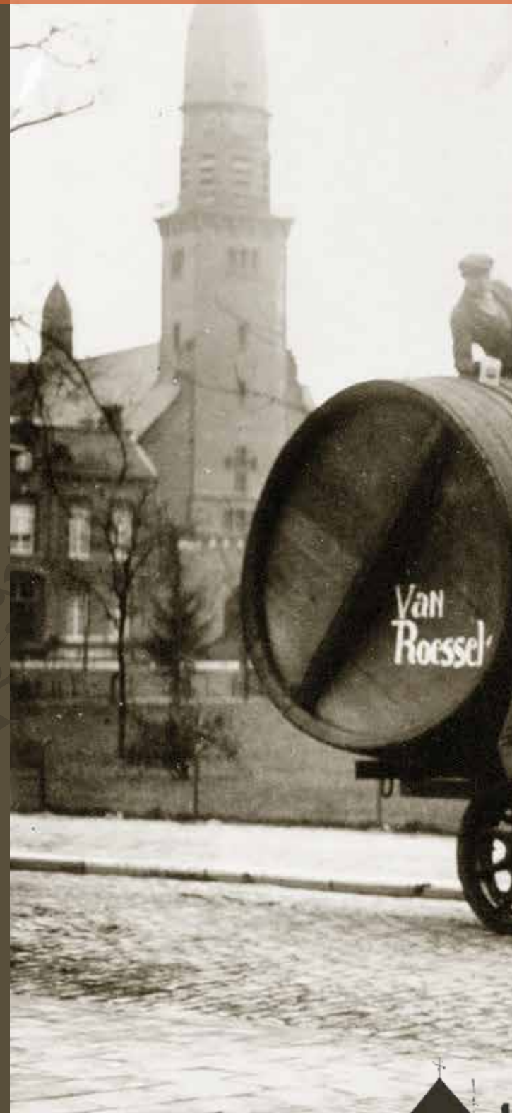
Ronald Peeters – Korvel Vooruit 100 jaar